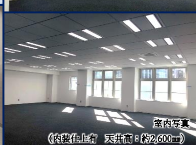
室内写真 (内装仕上り 天井高:約2,600mm)