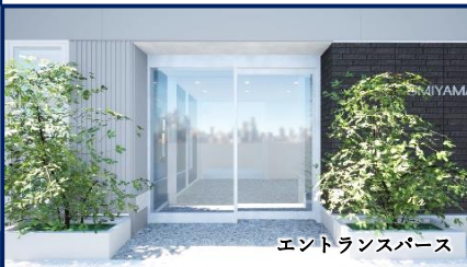
エントランススペース

●賃貸条件 総額賃料 賃料 相談 敷金 12ヵ月 ※契約時償却2ヵ月 礼金 無 更新料 無 契約期間 2年間 (普通賃貸借) 解約予告 6ヵ月 専有面積 46.55坪 備 男女別トイレ 機械警備 OAフロア 天井高2,600mm エレベーター1基(不停止機能有)