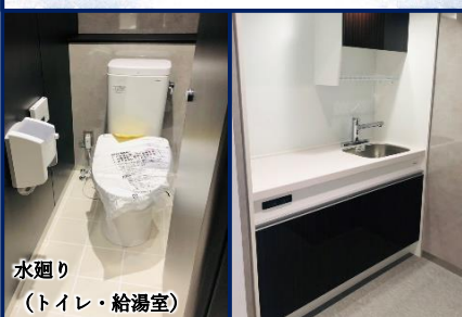
水廻り (トイレ・給湯室)